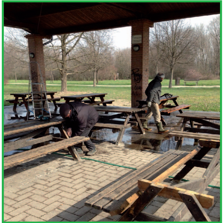
sistemazione dei tavoli sotto al portico