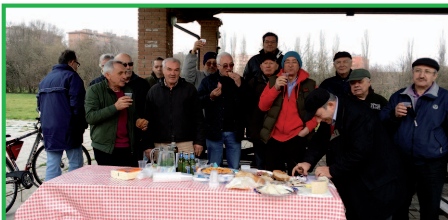
dopo il lavoro un meritato ristoro