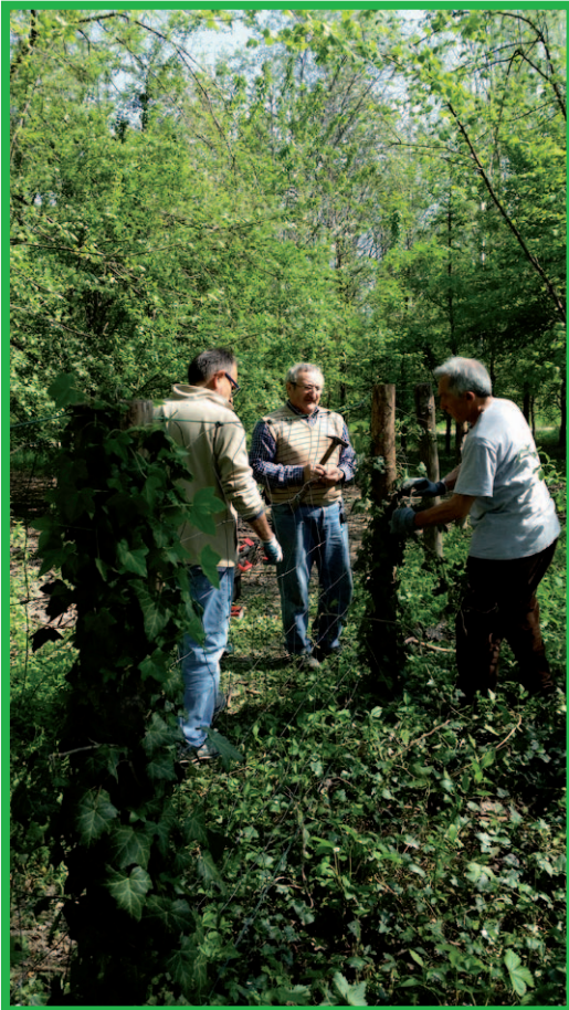
riparazione rete attorno al Cabanon