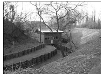
La realizzazione del nuovo sentiero lungo il fontanile Cagapess. (T. Anelli)