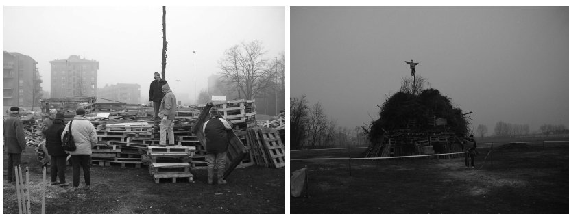
La preparazione della catasta per il falò del 17 gennaio.

Il falò di S. Antonio: un appuntamento che anche quest'anno La Risorgiva ha voluto organizzare in occasione del 17 gennaio. Una decisione non facile a seguito dei drammatici eventi del dicembre 2004 nel Sud - Est asiatico. Ha prevalso la volontà di continuare e quindi riproporre un evento diventato ormai tradizione a cui assegnare però un significato particolare e certamente diverso rispetto agli anni precedenti. Si è così deciso di raccogliere fondi e andare, insieme all'Amministrazione comunale e ad altre Associazioni di Settimo, a finanziare un progetto sostenibile e soprattutto utile per una delle tantissime comunità colpite dal maremoto.