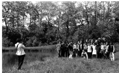
Scolaresche in visita al Bosco (R. Poggi)

gnanti, incontri con i ragazzi. Tutto questo perché le Scuole del territorio hanno scelto di guidare gli alunni alla scoperta dei vari aspetti (ambientali, naturalistici, storici) di Settimo Milanese. Ma non basta. Da varie scuole della provincia di Milano, sono già cominciate ad arrivare le prenotazioni per far trascorrere ad alcune classi una mattinata o un'intera giornata al Bosco, usufruendo dei percorsi didattici che La Risorgiva offre. Il lavoro davvero non manca, soprattutto se si pensa che, come già scritto nel precedente numero di questo giornale, fra settembre e novembre 2004, complice il favorevole andamento stagionale, gli alunni, provenienti dalle scuole del Comune di Settimo e della provincia di Milano, sono stati più di 400. Tutti impegnati a osservare e scoprire il Bosco o a svolgere la gettonatissima gara di orientamento. Mariarosa