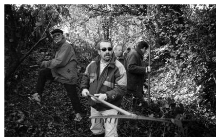
Interventi di manutenzione al fontanile Segnarca.