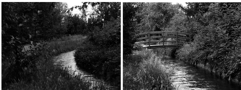
Il canale Villorresi al Bosco della Giretta.

Come è noto il Bosco della Giretta è attraversato da nord a sud dal canale Villorresi o per essere più precisi, da un ramo secondario dell'omonima rete irrigua lombarda. Quando si dice canale Villorresi si intende fare riferimento al Consorzio di Bonifica Est Ticino - Villorresi, costituito in base alla legge regionale n.59/84 e al Decreto 7647/90, ed erede del Consorzio di Bonifica Eugenio Villorresi, risalente al 1918. Il Consorzio ha mantenuto la gestione del canale omonimo con relativi rami secondari e terziari e ha assunto, dagli anni '80, anche quella dei Navigli Grande, Pavese, di Bereguardo e della Martesana. Una curiosità: il Naviglio Grande, risalente al XII° secolo e fondamentale via di trasporto per i materiali destinati alla costruzione del Duomo di Milano, è ancora oggi, unico tra i navigli milanesi, ad essere classificato via navigabile.